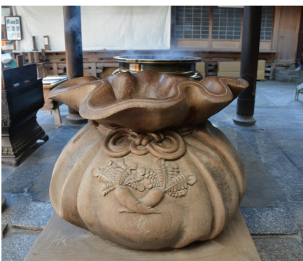
二つのシンボルを組み合わせた賽銭箱

奥の院までの道にはお地藏さんや観音さまなどたくさんのお石仏がならんでいます。宝山寺には一円と五円の両替システムがあるので、ひとつひとつの石仏にしっかりと参りしながら奥の院へ進むことができます。